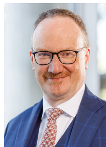
Lars P. Feld Führender Ökonom